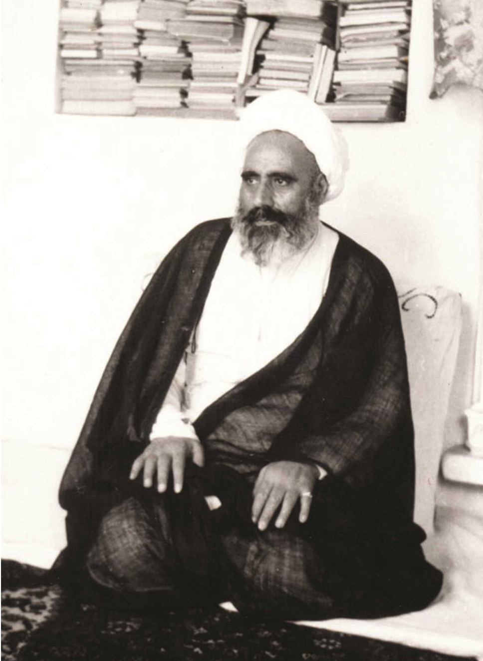
تمثال مبارک مرحوم علامہ امینی